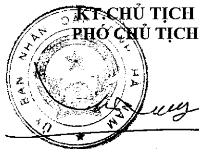
Trương Quốc Huy