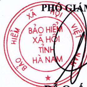
Đỗ Quốc Hòa